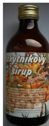
Sirup z biorakytníku