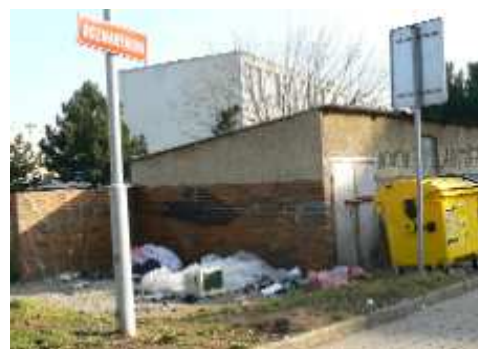
Situace v únoru 2008, Rozmarýnová ulice v Mostě

Více článků naleznete na http://mostecky.denik.cz/kratce_region/ .