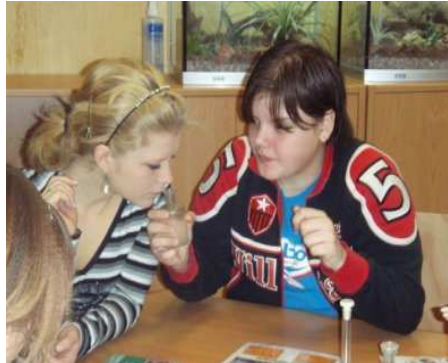
Součástí výukových programů jsou aktivity řešené ve skupinkách. Jedna z aktivit je věnována také

Největší zájem je o program Chemie a životní prostředí, který je díky sponzoringu pro 30 tříd z Mostecka nabízen v říjnu a listopadu zdarma. Ostatní programy jsou zpoplatněny částkou 50 Kč na žáka. Během programu, který trvá dvě hodiny, se školáci a studenti seznámí s tím, co mohou v chemičce vidět, slyšet a cítit. Pozornost bude věnována jak vlivu chemické výroby na jednotlivé složky životního prostředí, tak i vlivu produktů chemické výroby. A jelikož nic není černobílé, seznámí se i s tím, kde se již bez těchto výrobků de