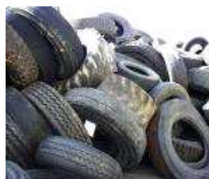
Pneumatiky jako surovina

Účastníci měli možnost vyslechnout zajímavé prezentace zástupců obcí, krajů, podnikatelské sféry, vzdělávacích a výzkumných institucí. Velmi přínosné byly příspěvky zástupců podnikatelské sféry. Vyslanec firmy Montstav s.r.o. představil činnost tohoto subjektu – zpracování ojetých pneumatik jako druhotné suroviny. Montstav nevyrobí jen z opotřebovaných pneumatik tzv. protektory, ale dalšími technologickými postupy přetváří tento „odpad“ na prakticky velmi dobře využitelné produkty. Pádové plochy pro dětská hřiště, gumové potahy na betonové obrubníky zvyšující bezpečnost, dlažby s pryžovým povrchem, protihlukové tvárnice, sportovní plochy, ale i granulát pro sorpci a následnou likvidaci uniklého benzínu