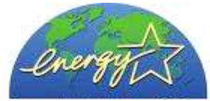
Logo spotřebiče s nízkou provozní spotřebou energie

Tento ale i spoustu jiných titulů nabízíme k zapůjčení v naší kanceláři Ekologického centra Most pro Krušnohoří.